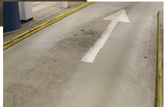
4 vuotta korjauksen jälkeen