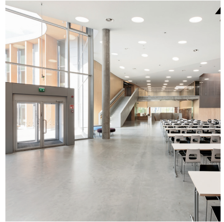
Mårtensbro Skola, Espoo