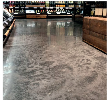
Töölön Alko, Helsinki / KCF