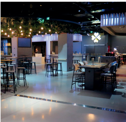
Tampereen Casino / TRU PC

PiiMatin DesignTop -sirote sisältää lisäaineita ja mikropolymeerikuituja, jotka parantavat sen ominaisuuksia arkkitehtonisena pintana. PiiMat DesignTop on saatavissa 15 eri värisävyyssä. Värien osalta on huomioitava, ettei pinta ole maalatun tapaan tasavärisen, vaan elävä.