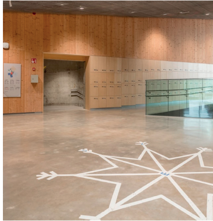
Opinjmäen koulu, Espoo