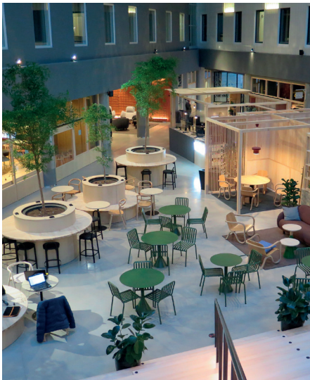
VALO Hotel&Work, Helsinki