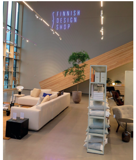
Finnish Design Shop, Turku