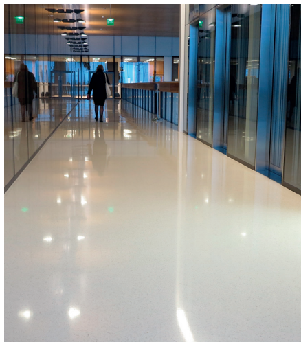
Lähitapiola, Espoo / Granidur Bianco