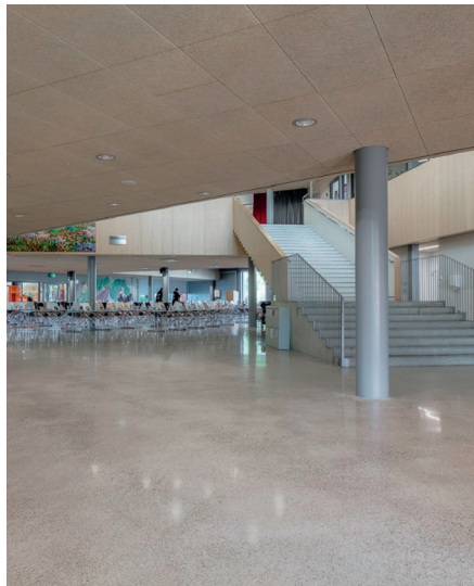
Nikkilän sydän, Sipoo